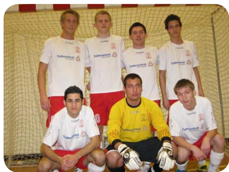
Døvania 1 – DM i Futsal 2011

Døvania 1 endte på en 3. plads og vil derfor i 2012 igen være at finde i 1. division, hvor Døvania 2 i 2012 må nøjes med igen at skulle spille 2. division. Døvania 2 spillede dog en flot turnering og var kun 2 point efter andenpladsen i 2. division som ville have medført en playoff kamp om oprykning til 1. division.