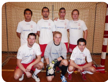
Døvania 2 – DM i Futsal 2011

Som følge af at Døvania har opstillet et 11 mands hold i KBU turneringen, har det betydet at prioriteringen af 7-mands er ned-