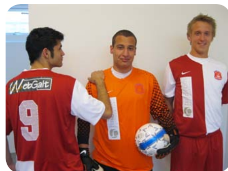
Døvanias nye sponsorer påtrykt på det nye kamptøj.

Denne frihed betød at fodboldafdelingen fik muligheden for at indgå et hovedsponsorat med WebGait og hildrum | fysioterapi som kun er gældende for Døvanias fodboldherre, hvilket er en aftale som vi i fodboldafdelingen er meget stolte og glade over. Der er tale om to rigtig spændende virksomheder som har valgt at støtte Døvanias fodboldhold igennem et hovedsponsorat, hvilket i sig selv er et skulderklap til fodboldafdelingen bl.a. pga. den økonomiske situation i samfundet i øjeblikket, som uden tvivl gør muligheden for klubsponsorater betydeligt sværere.