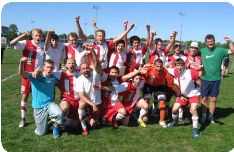
Døvania holdet efter 2-0 sejr

at Døvanias unge trup er godt på vej til at blive det nye tophold i Døveligaen.