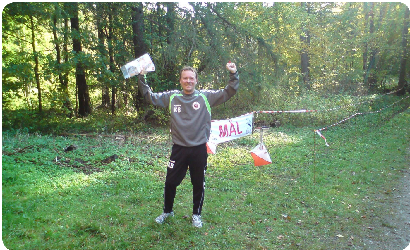
KB er stolt og lykkelig efter at have gennemført o-løbet efter 20 års

Vi havde planlagt, og syntes en rigtig godt tidspunkt for os og an-